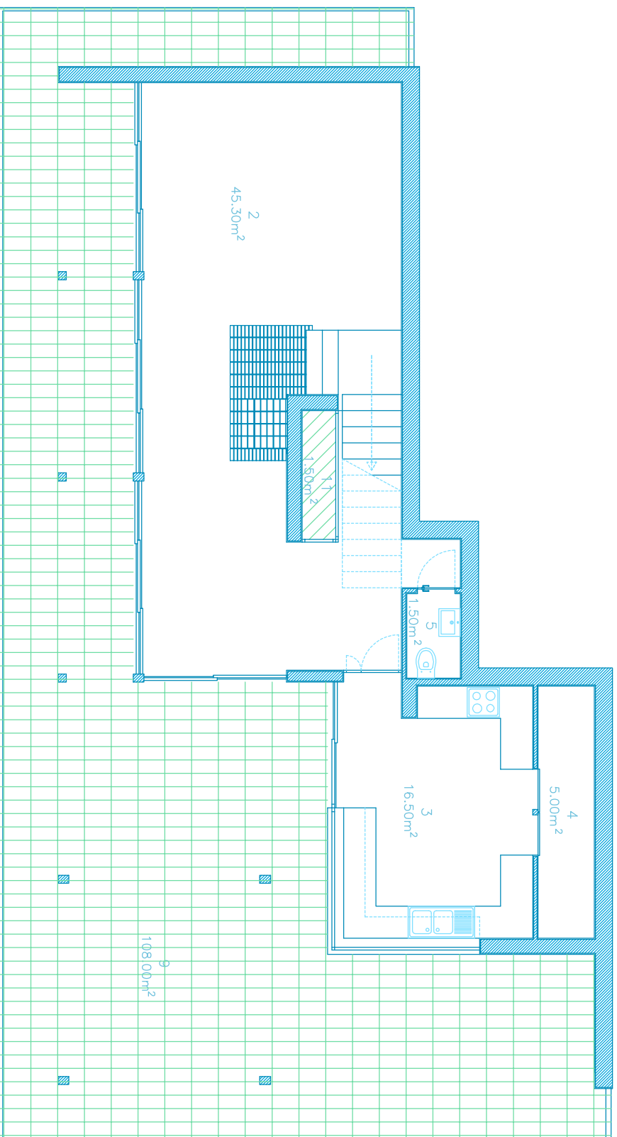
PLANTA PISO -1